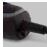
Cavo di rete sostituibile