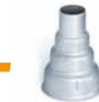
Ugello riduttore 14 mm Art. ST070717