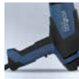
Superficie di appoggio antiscivolo