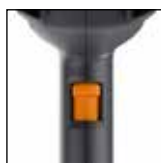
Ventilatore a 2 livelli