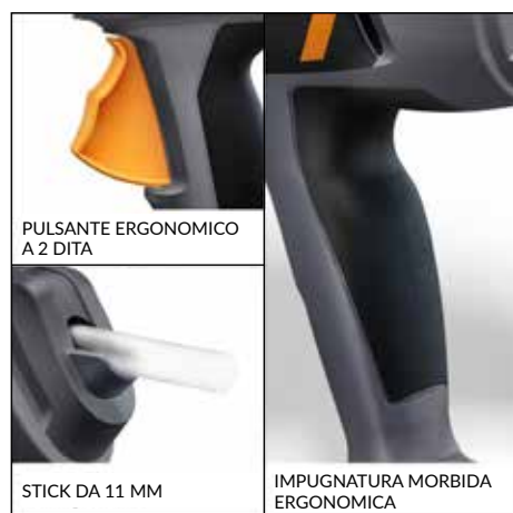
PULSANTE ERGONOMICO A 2 DITA