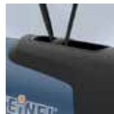
Possibilità di aggancio