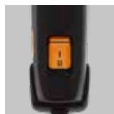
Ventilatore a 2 livelli