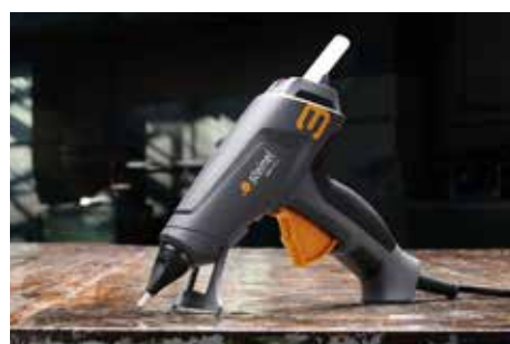
IMPUGNATURA MORBIDA ERGONOMICA