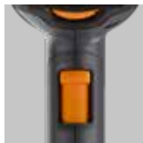
Ventilatore a 3 livelli