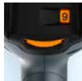
Regolazione continua della temperatura