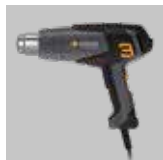
Baricentro dell'apparecchio ottimizzato