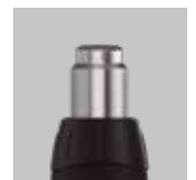
Adatto per "ugelli standard" a innesto