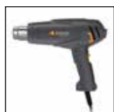
Baricentro dell'apparecchio ottimizzato

Il convogliatore ad aria calda regolabile in due stadi HL 1620 S diventa presto irrinunciabile. Ideale per asciugare l'intonaco, calettare cavi, scongelare tubi dell'acqua, asportare vernice, sciogliere sci e snowboard, e molti altri usi. Con due stadi di temperatura: 300 °C e 500 °C.