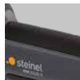
Impugnatura morbida ergonomica