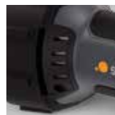
Ingresso aria con filtro per polveri fini integrato