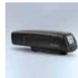
Scanner termico optional HL Scan